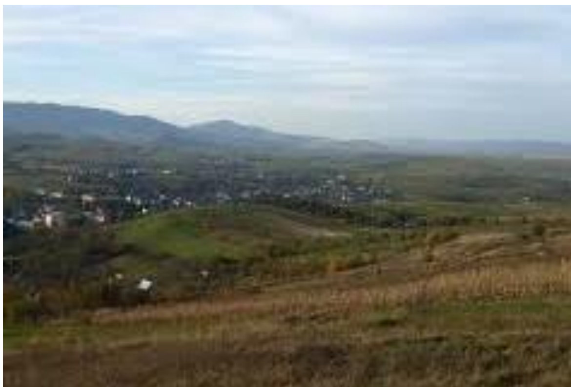
Figura O2. Arealul montan Munții Stânișoarei - Ghindăoani